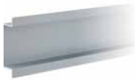
Aluminium inbouwprofiel 2.1m Art.nr. FMH01-AEX2100