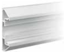
Opbouwprofiel Wit Art.nr. SMH02-WEX2100

De Mainline® stroomrail kan u discreet installeren en inbouw of opbouw. De profielen zijn verkrijgbaar in dezelfde kleuren als de stroomrail en de verplaatsbare stopcontacten.