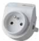
Stopcontact Art.nr. MLP4W