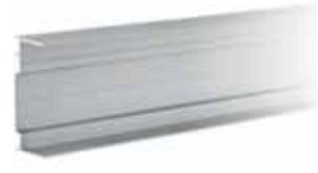
Aluminium C-in- of opbouwprofiel Art.nr. MLEX21